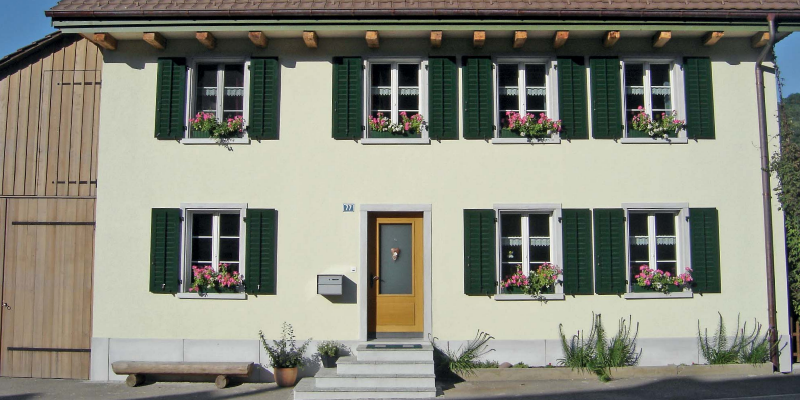
Gewändeelemente aus Glasfaserbeton